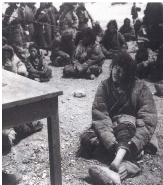
Pán potrestal otroka za provinění odseknutím nohy