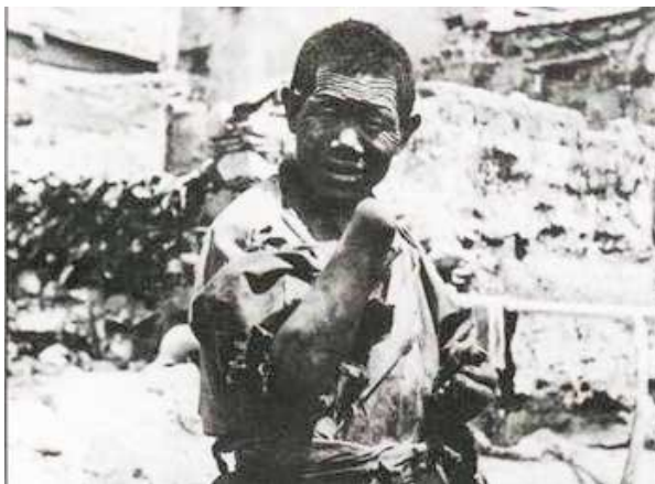
Otrok, kterému jeho pán nechal odříznout ruku