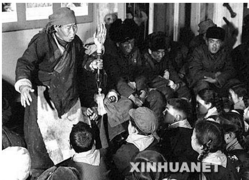
Otrokyně drží ruku muže, kterou mu usekli předtím, že byl zaživa pohřben.

A nyní něco o tom, za co mohl být otrok potrestán. Je znám případ, kdy hospodář poslal otroka do odlehlé vesnice s úkolem. Ten se nestihl vrátit před setměním a tak přenocoval cestou na poli. Jak se ukázalo, toto pole patřilo nějakému místnímu majiteli a ten požadoval od otroka za přenocování peníze. Otrok peníze samozřejmě neměl, a tak mu za trest usekli ruku. Když se zesláblý vrátil zpátky ke svému pánovi, ten, rozhněvaný skutečností, že zdravý dobrý otrok se stal invalidou, přikázal mu useknout i druhou ruku. Nezaslouží si tato nádherná pohádková země všemožnou podporu ze strany organizací ochraňujících lidská práva?