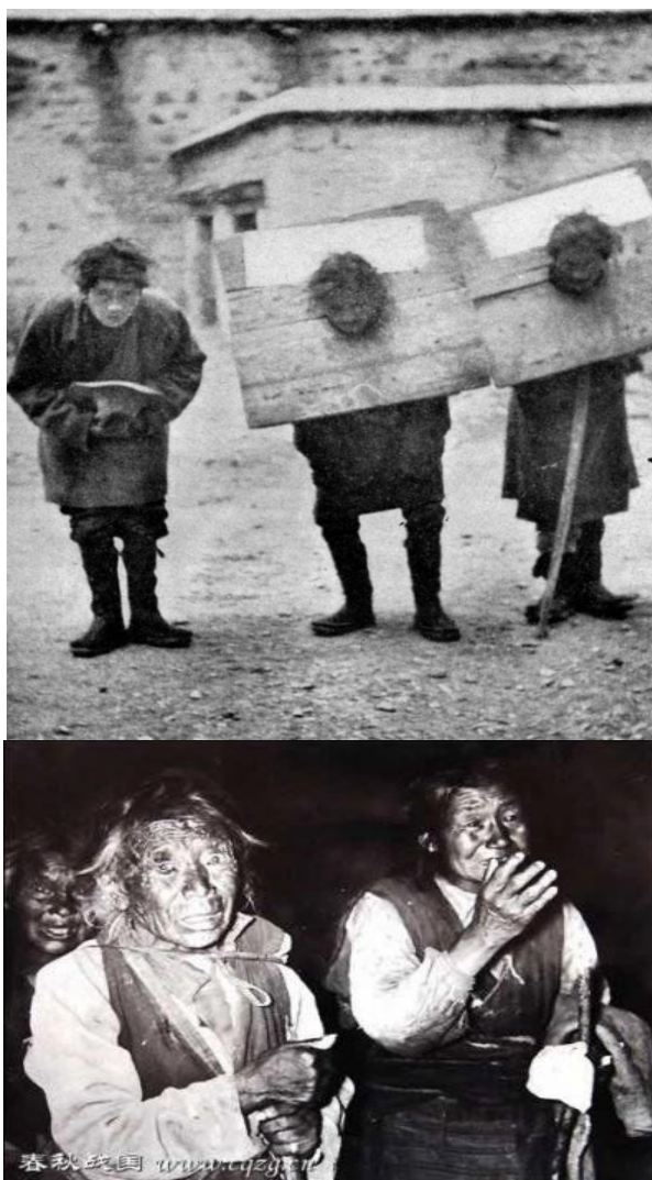
Otroci žebrající o jídlo

K sobě připoutaní otroci, z nichž jeden je bezruký