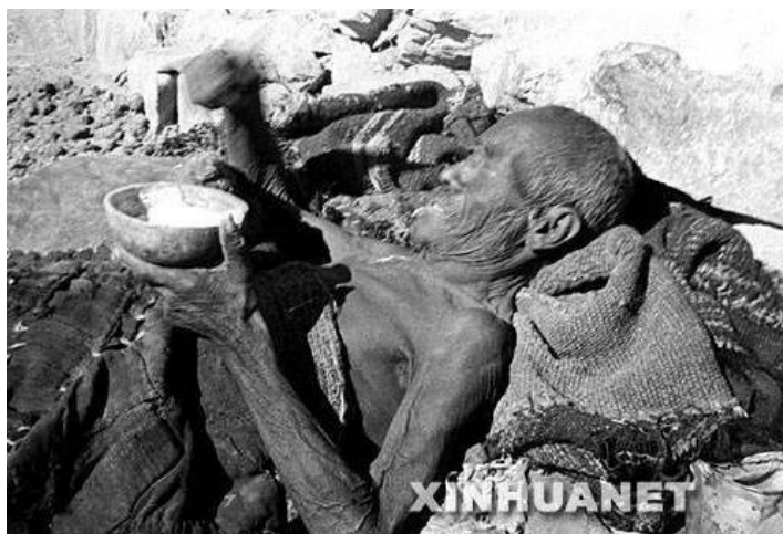
Starý umírající otrok.