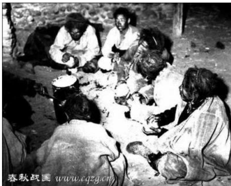
Otroci při jídle (jedli jednou denně)

日喀则女奴央金，由于劳累过度，长年营养不良，年仅35岁的中年人，憔悴不堪，如同一个五、六十岁的老妇。