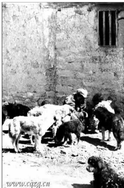
Chlapec-otrok a psi: jedna miska jídla pro všechny