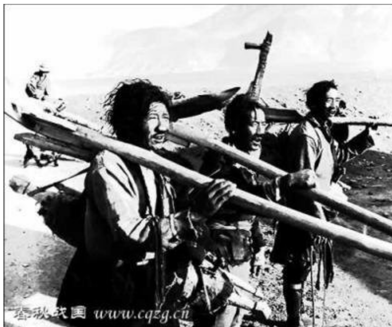
Tibetští otroci jdou do práce